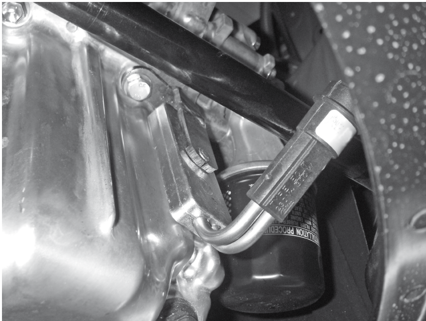
TOYOTA Aygo 1.0 2015- ⚙️ 1KR-FE