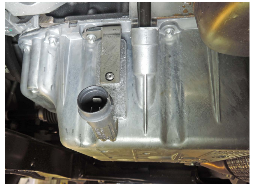
OPEL Mokka 1.6 2016- ⚙️ B16XER

= Motortyp ⚙️ = Moottorityyppi = Engine model